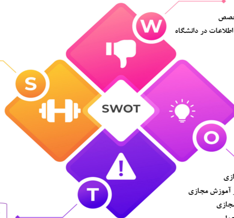
شکل ۱. تحلیل نقاط قوت و ضعف، فرصت و چالش های مرکز آموزش مجازی